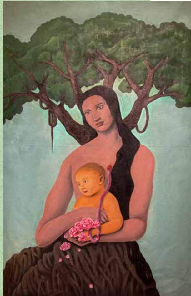
I am not a gardener, door Jordan, uit Dhaka. Dit kunstwerk is gemaakt tijdens een workshop activism, door de Bengaalse Brac University georganiseerd, en toont de liefde van een transgender-vrouw voor een baby, waarbij de navelstreng niet vanuit de baarmoeder maar vanuit het hart loopt

kunnen brengen, stopt ze ondanks de intimidaties niet met haar onderzoek, campagnes en rechtszaken. Als directeur van de Alianza Sierra Madre (ASMAC) werkt ze veel met de Ódami- en Rarámuri-gemeenschappen, die haar organisatie juridisch advies en trainingen geeft om hun leefgebied en collectieve rechten te verdedigen.