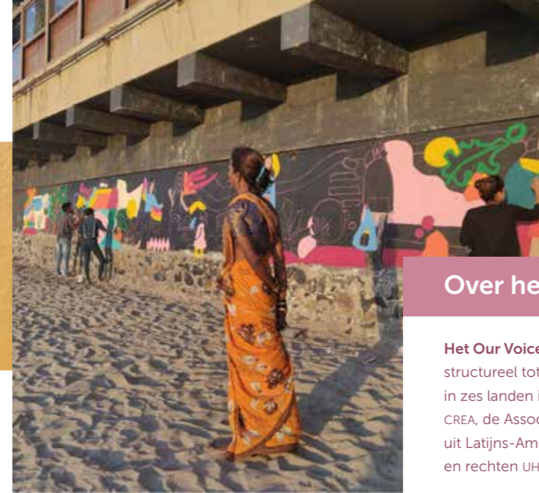
De leden van Aravani Art beschilderen een strandmuur in de Indiase stad Mumbai