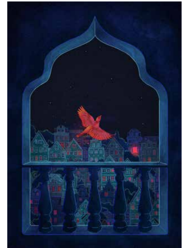
Illustratie door het Queer Muslim Project, dat steun van CREA ontvangt. Als hoofdorganisatie van OVOF houdt CREA zich bezig met het ontwikkelen en inzetten van activism voor sociale verandering

Op de meeste lijstjes van de gevaarlijkste beroepen ter wereld prijkt houthakker op de eerste plaats: per honderdduizend houthakkers verliezen gemiddeld 111 van hen het leven door een heftige verwonding of val. Ook in de top vijf van riskante beroepen: mijnbouwers en transporteurs van ruwe olie.