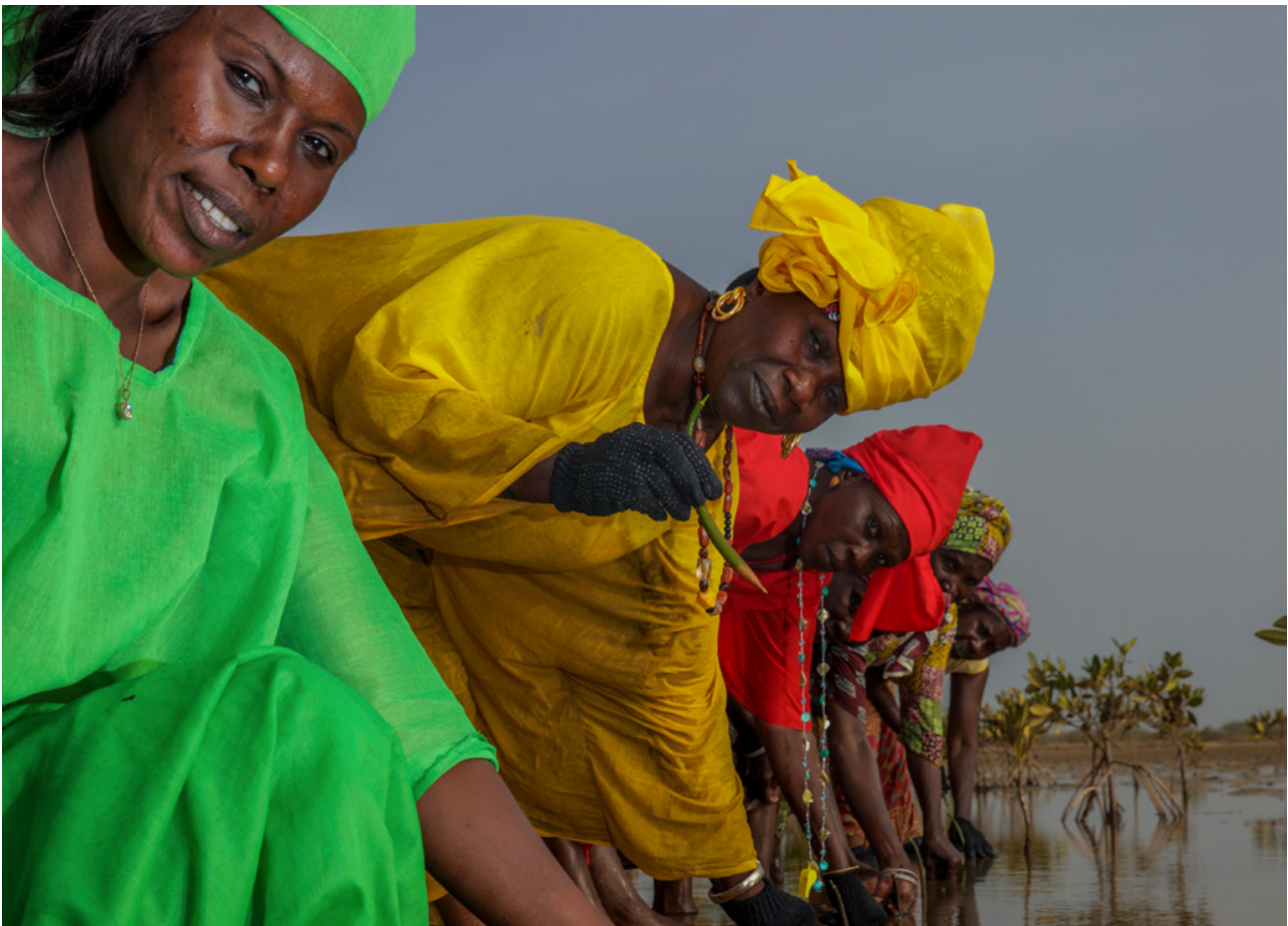
Lokale vrouwengroep die oesters kweekt en klimaatadaptatie leidt op het eiland Djirnda in Senegal.

(BITS). 107 Naar verwachting is dit bedrag in de praktijk nog vele malen hoger, omdat veel ISDS-arbitrage niet wordt geregistreerd en via andere handels- en investeringsovereenkomsten ook kunnen worden aangespannen. Door de enorme bedragen die gemoeid zijn met de schadeclaims, worden regeringen afschrikt om strengere milieu- en klimaatmaatregelen te implementeren, uit angst voor kostbare rechtszaken en schuldenlast. Bovendien leiden deze aanzienlijke financiële lasten voor gastlanden ertoe dat er minder middelen beschikbaar zijn voor publieke diensten die essentieel zijn voor het bevorderen van gendergelijkheid, zoals onderwijs en gezondheidszorg. 108 Daarom onze aanbeveling om te stoppen met ISDS-afspraken.