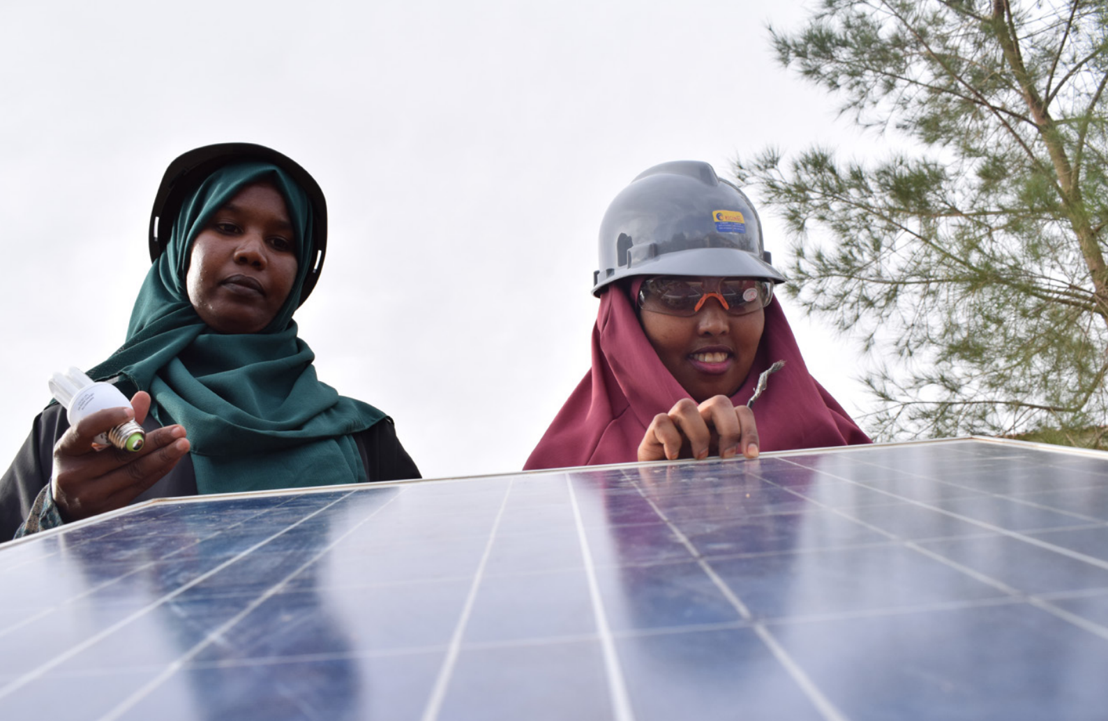
Twee Somalische trainees werken aan een zonnepaneel, als onderdeel van een groot onderwijsprogramma krijgen meer jongeren technisch onderwijs.