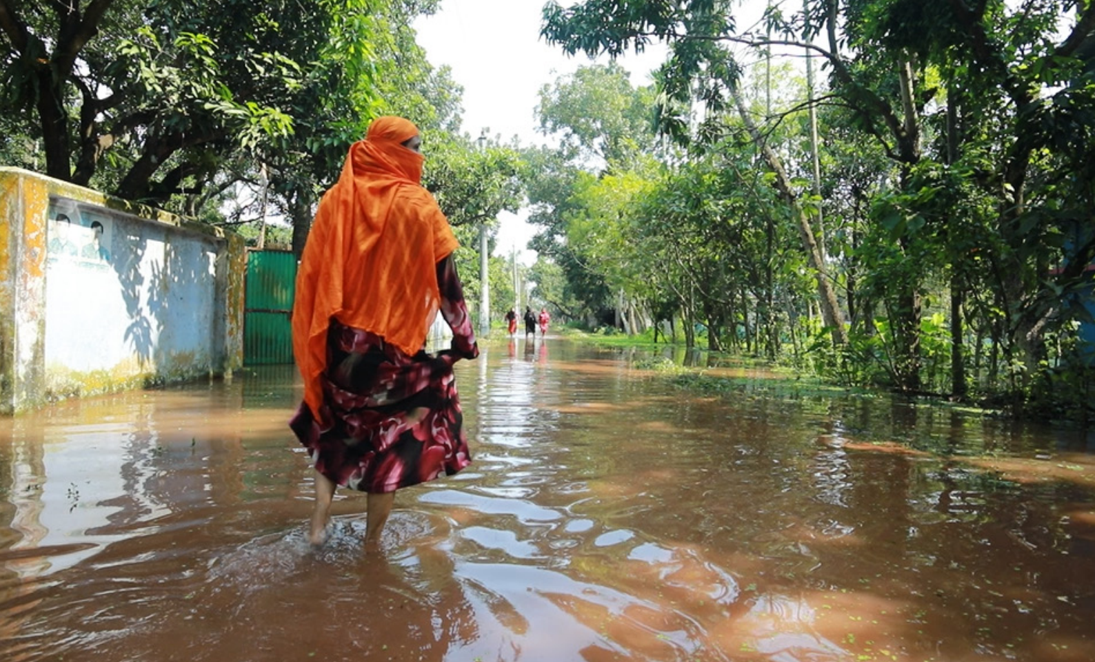
Bewoners in het Satkhira-district (Bangladesh) die letterlijk zeven maanden per jaar tot hun enkels in het water staan. Door klimaatverandering nemen overstromingen in dit gebied toe. (november 2021)

(GCF) 55 , het grote klimaatfinancieringsfonds dat werd opgericht onder het VN-klimaatverdrag, zet groot in. 79% van de GCF-financiering verloopt via internationale instituties, en 40% van de GCF-financiering wordt beheerd door vijf internationale actoren die zich vooral richten op grootschalige projecten. Die blijken onvoldoende effectief in het bereiken van het lokale niveau. 56