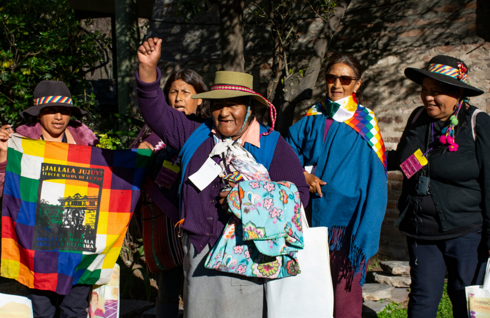
Feminist Just Transition Conference. Foto: Johanna Ansiporovich/Tierra Nativa (2023)

Door te blijven investeren in fossiele projecten blijft niet alleen de uitstoot van CO2 stijgen waardoor de aarde verder opwarmt. Dergelijke projecten hebben ook desastreuze gevolgen voor ecosystemen en mensen die daarvan afhankelijk zijn.