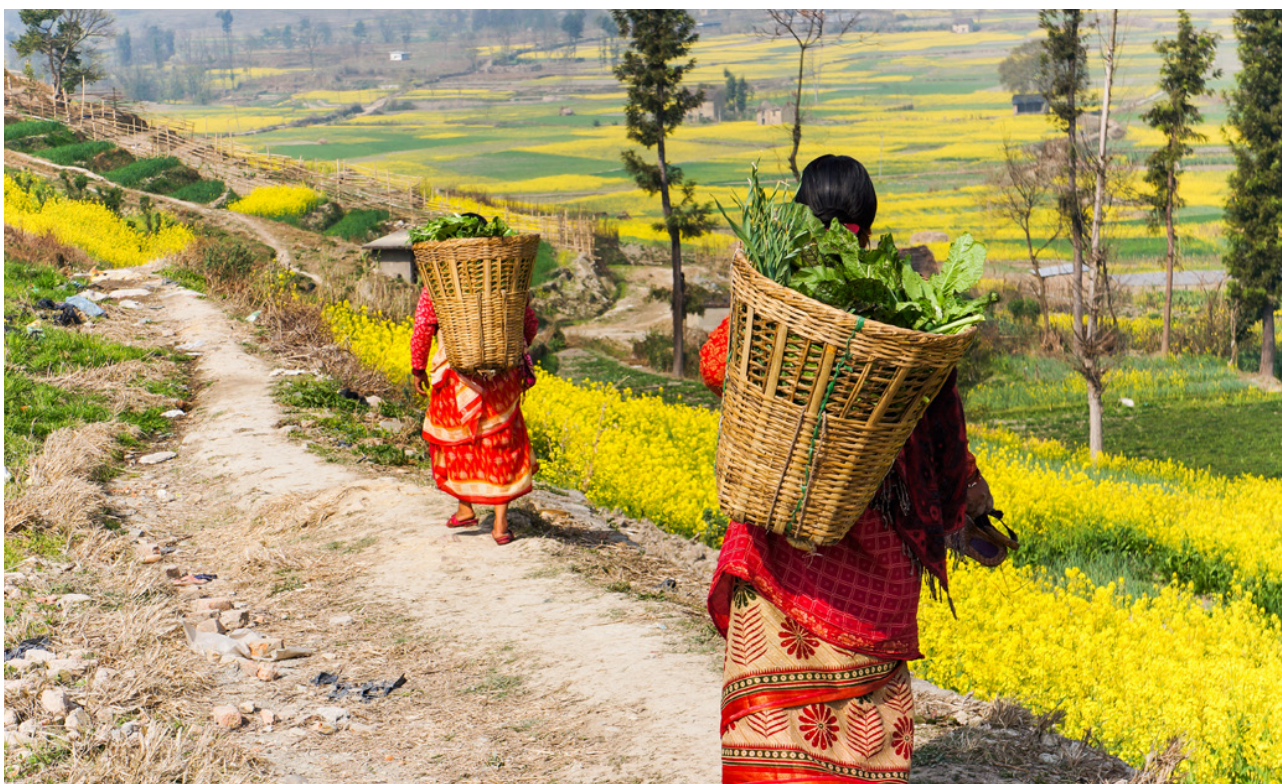
Vrouwelijke boeren in Nepal.